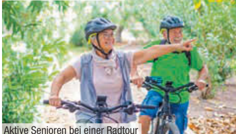
Aktive Senioren bei einer Radtour