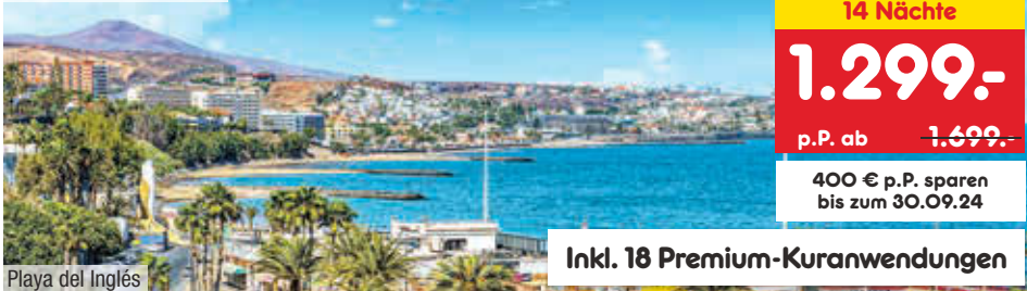
Playa del Inglés

14 Nächte 1.299.- p.P. ab 1.699.- 400 € p.P. sparen bis zum 30.09.24