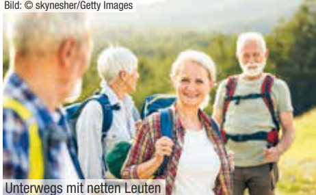
Unterwegs mit netten Leuten