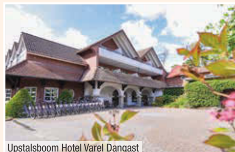
Upstalsboom Hotel Varel Dangast