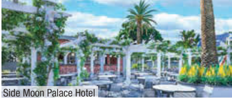
Side Moon Palace Hotel