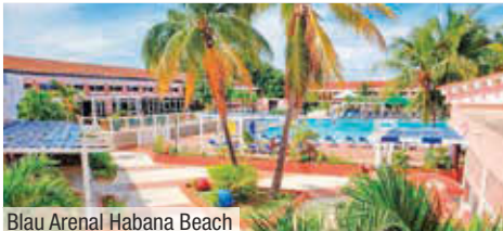
Blau Arenal Habana Beach