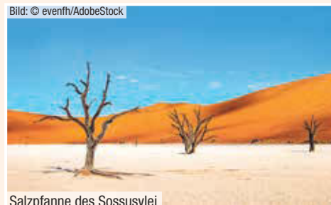
Salzpfanne des Sossusvlei