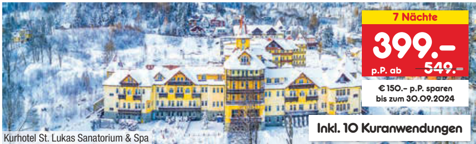
Kurhotel St. Lukas Sanatorium & Spa

7 Nächte 399.- p.P. ab 549.- € 150.- p.P. sparen bis zum 30.09.2024