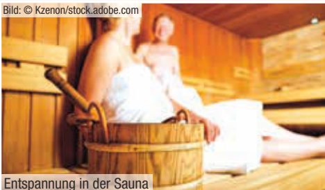
Entspannung in der Sauna