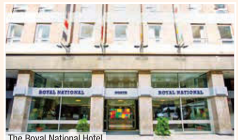
The Royal National Hotel

• Hotel in zentraler Lage, nahe dem Covent Garden, dem British Museum, der Oxford Street und den Theatern der Stadt. Zur U-Bahn-Station Russell Square (Piccadilly Line) sind es nur wenige Minuten. Von hier aus gelangt man schnell in das nahe gelegene Stadtzentrum. In der Umgebung des Hotels gibt es verschiedene Restaurants, Bars, Einkaufs- und Unterhaltungsmöglichkeiten. Entfernung Flughafen Heathrow Airport ca. 29 km