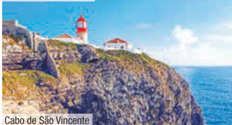
Cabo de São Vicente