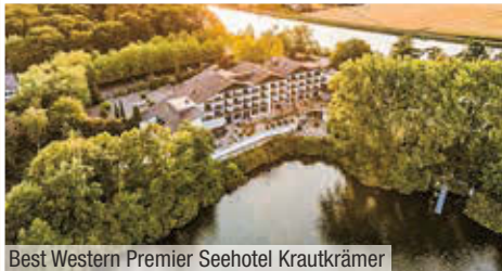
Best Western Premier Seehotel Krautkrämer