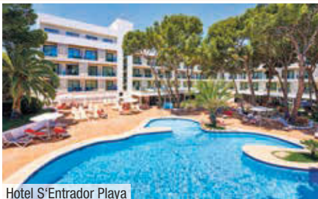
Hotel S'Entrador Playa