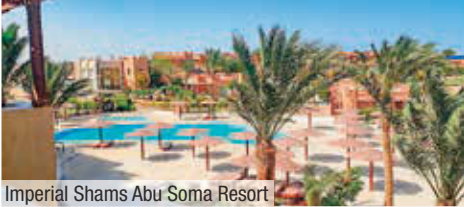
Imperial Shams Abu Soma Resort