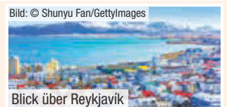
Blick über Reykjavik