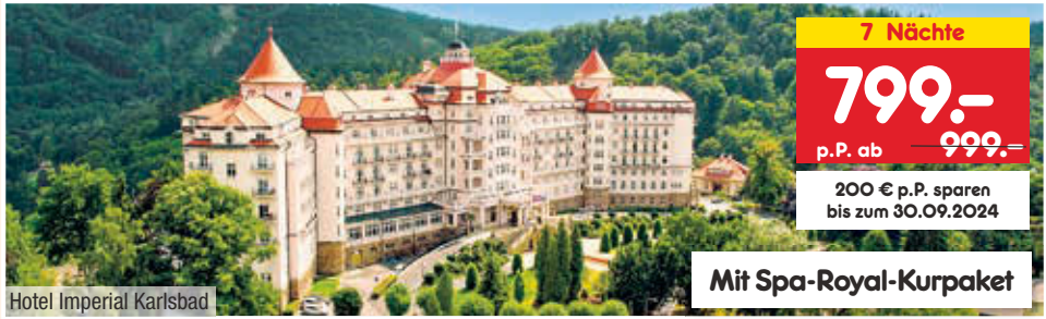
Hotel Imperial Karlsbad

7 Nächte 799.- p.P. ab 999.- 200 € p.P. sparen bis zum 30.09.2024