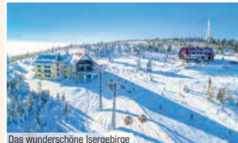
Das wunderschöne Isergebirge