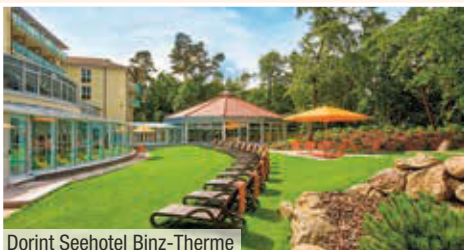
Dorint Seehotel Binz-Therme