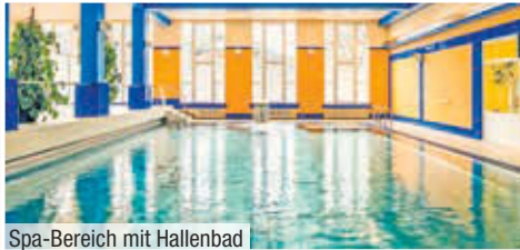
Spa-Bereich mit Hallenbad