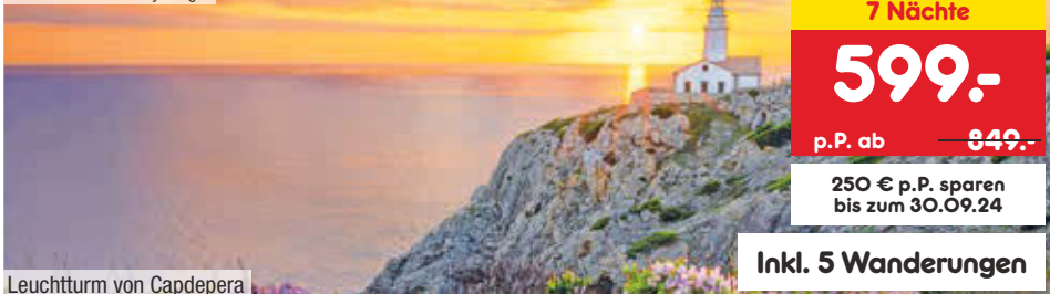
Leuchtturm von Capdepera