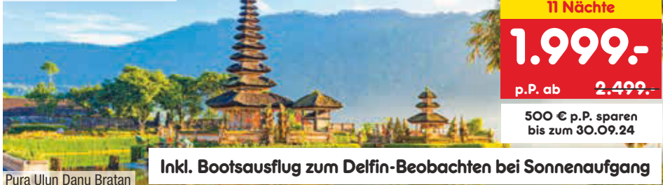
Pura Ulun Danu Bratan