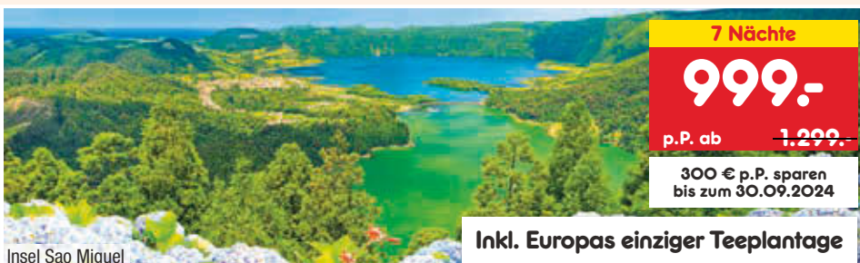
Insel Sao Miguel