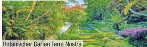
Botanischer Garten Terra Nostra