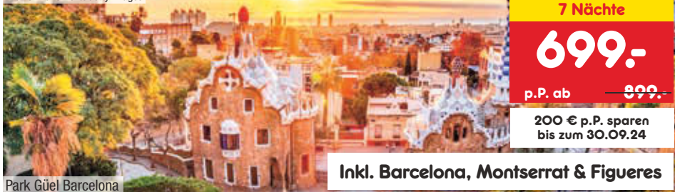
Park Güel Barcelona