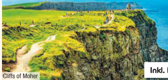
Cliffs of Moher