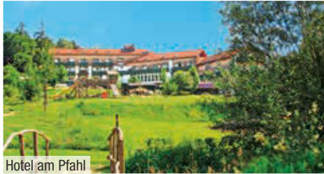
Hotel am Pfahl