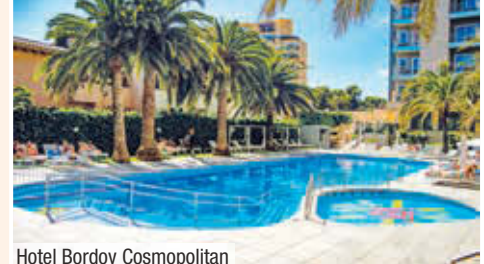
Hotel Bordoy Cosmopolitan