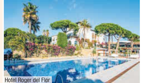
Hotel Roger del Flor