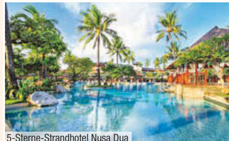
5-Sterne-Strandhotel Nusa Dua