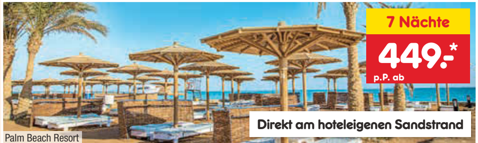
Palm Beach Resort

*Günstigster buchbarer Preis zum Stand 14.08.2024, endgültiger Preis bestimmt sich anhand der zum Buchungszeitpunkt gültigen Preise der Leistungsträger. Flughafenzuschlag und/oder Saisonzuschlag möglich. Es gelten die ausgeschriebenen Leistungen & AGB des jeweiligen Reiseveranstalters unter netto-reisen.de