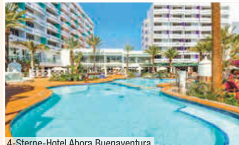
4-Sterne-Hotel Abora Buenaventura