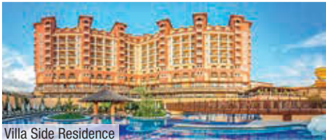
Villa Side Residence