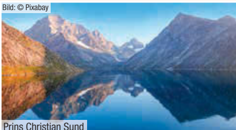
Prins Christian Sund